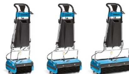
R30B R45B R60B