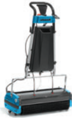
R30A / R30S